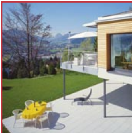
Ein MINERGIE®-Haus behält seinen Wert langfristig. (AG-001)