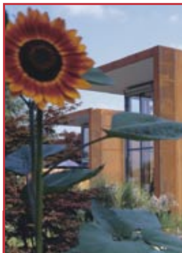
Ein MINERGIE®-Haus ist gut zur Umwelt. (SG-207)